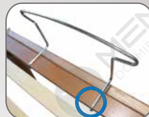
Inserire lato sinistro