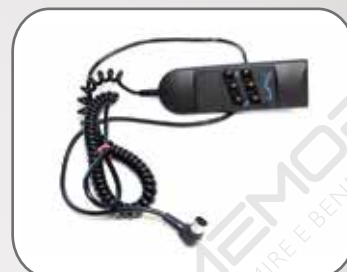
1 telecomando per il motore (solo nelle reti motorizzate)