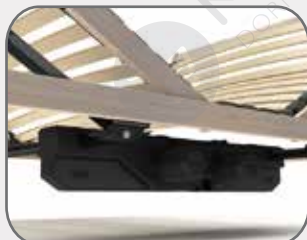
Il motore è già installato

La rete motorizzata presenta già il motore installato con cavo di alimentazione già collegato al motore e va solo inserita la spina alla presa di corrente.