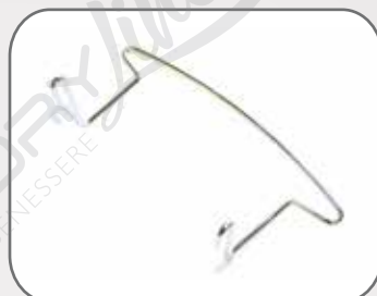
1 ferma materasso lato piedi (solo nelle reti manuali e motorizzate)