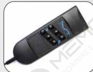
Adesso telecomando e motore sono funzionanti