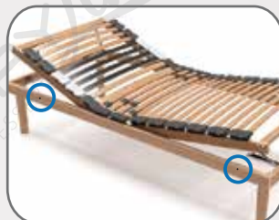
Individuare i 2 fori laterali in prossimità di testa e piedi