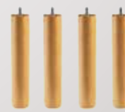
Kit 4 piedi altezza 35 - 40 cm