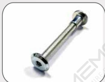
1 vite con dado per unire due reti e formare la matrimoniale (questa vite non va utilizzata per chi acquista la sola rete singola)