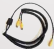
Cavo Y sincro reti motorizzate