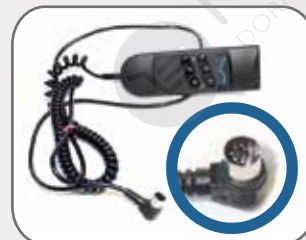
Telecomando da collegare alla presa sul motore