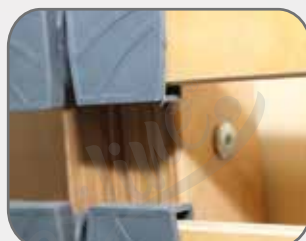
Avvitare fino in fondo. Ripetere l'operazione per entrambi i fori.