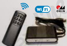
Telecomando wireless senza fili