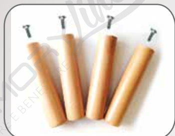
4 piedi (h. 30 cm) e 4 viti con testa autobloccante

Contenuto della confezione (per ogni singola rete)