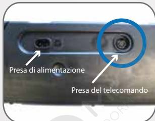
Individuare la presa del telecomando

Lo spinotto nero (a cinque poli) del telecomando va inserito nell'apposita presa sul motore evidenziata con cerchietto nella figura accanto.