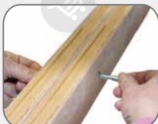
Accostare l'altra rete in modo da passare la vite da un telaio all'altro, quindi avvitare il dado

Inserire per ogni foro, una vite da una parte e avvitare il dado dall'altra parte. Ripetere l'operazione anche per l'altro foro. Alla fine le reti saranno fissate.