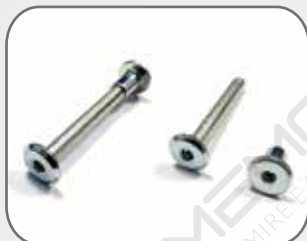
Viti e dadi per il fissaggio

Individuare i due fori laterali nel telaio fisso quindi utilizzare le due viti e i rispettivi dadi (in dotazione una per ogni rete)