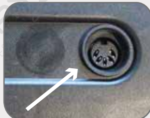
Inserire lo spinotto del telecomando nell'apposita presa sul motore