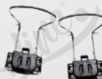
Coppia ferma materassi laterali