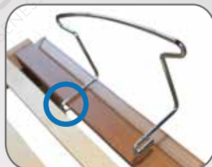
Inserire lato destro